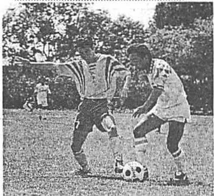
競り合う岩手県「野武士」(左)と「古河A」 —リバーフィールド古河で