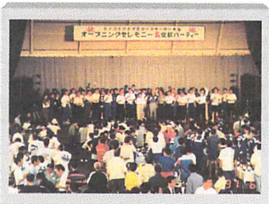
歓迎レセプションの乾杯は盛大に！！