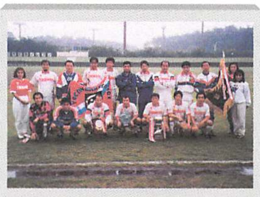
3度目の優勝を飾った 横浜シニア(神奈川)