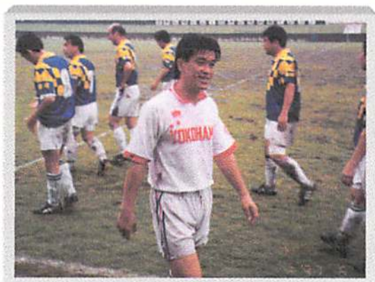
決勝で鮮やかなFKを決めた元横浜FC監督早野氏