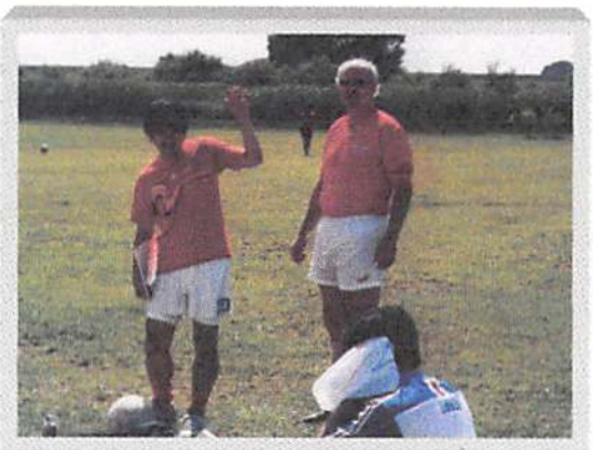
大会もインターナショナル？外国からの参加者