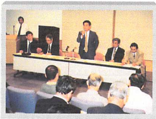
昨年に引き続き、代表者会議は『福祉の森』懇親会は『武蔵屋本店』で開催