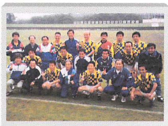
初の決勝進出で準優勝の 古河壮年サッカー愛好会