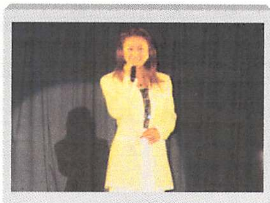
昨年に続き『広畑あつみ』歌手にお越しいただきました