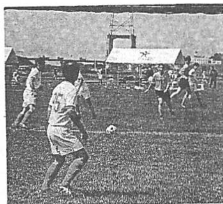
「百里・四十雀」と「東京四十雀」の熱戦

北は青森県から南は兵庫、約二千五百人が参加し、古河まで全国から百六チーム、古河市立サッカー場など四会場場で七日から開かれていた第七回「古河市マスターズ」大会が、八日(9日)の夜、閉幕した。