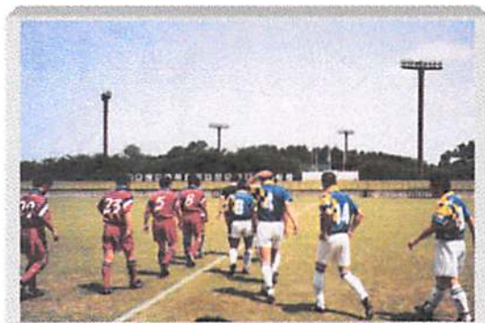
熱い思いを胸にいざピッチへ