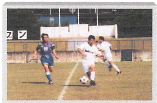
川崎から参戦！古河のピッチで躍動