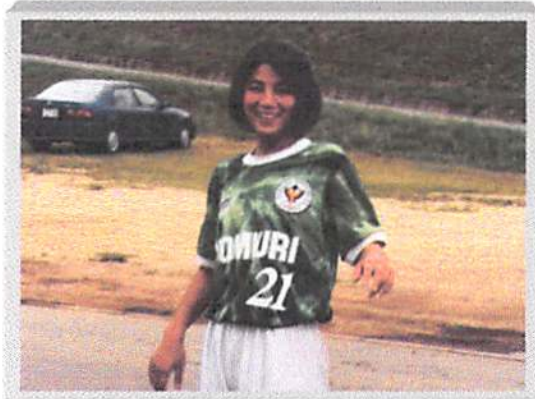
当時は少なかった女性プレーヤーも大会に参戦！