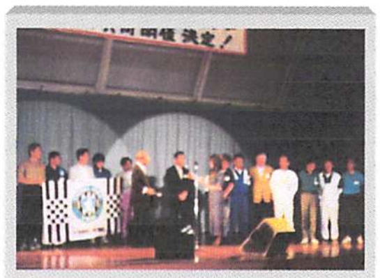
W杯日韓共催が直前に決定！ 神戸からも震災を乗り越えご参加頂きました