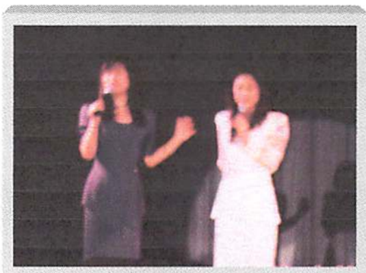
歓迎レプションには広畑あつみ歌手がゲスト出演