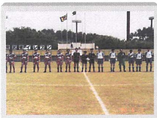
決勝戦は萩エクラブ vs 東京北区四十雀