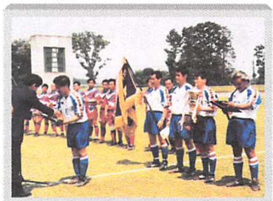
東京北区四十雀(東京)が念願の初優勝を果たしました